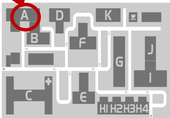
Obrázek 2 Mapa areálu nemocnice