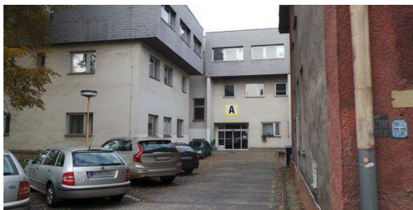
Obrázek 3 Fotografie budovy A