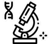
Vyšetření vzorků v laboratoři